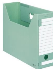
ファイルボックス