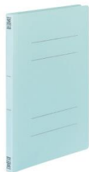
フラットファイル